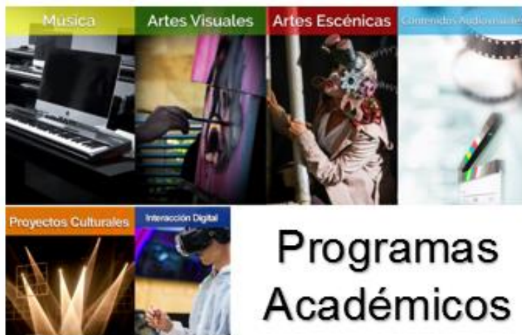
Ilustración 1: Fuente Propia

El Proyecto Educativo Institucional de la Escuela Superior Tecnológica de Artes Débora Arango está enmarcado en un modelo de formación que nace de una profunda reflexión pedagógica a partir del concepto tradicional disciplinar asignaturita, hasta mutar a un nuevo paradigma fundamentado en competencias, ciclos secuenciales y complementarios y un modelo pedagógico alternativo, lo cual se inserta en un nuevo contexto social y económico sin dejar de lado el concepto de lo artístico, formando a sus estudiantes como seres autónomos, competentes, creativos, críticos, éticos, solidarios y sensitivos, en lo social y lo cultural.