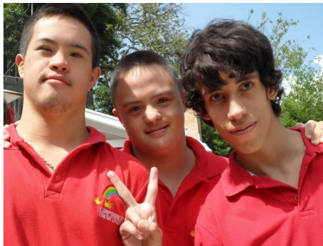
Ilustración 12: Estudiantes crear unidos

Se atienden en talleres de dibujo, pintura y danzas con docentes especializados a 46 personas en promedio con discapacidad cognitiva.