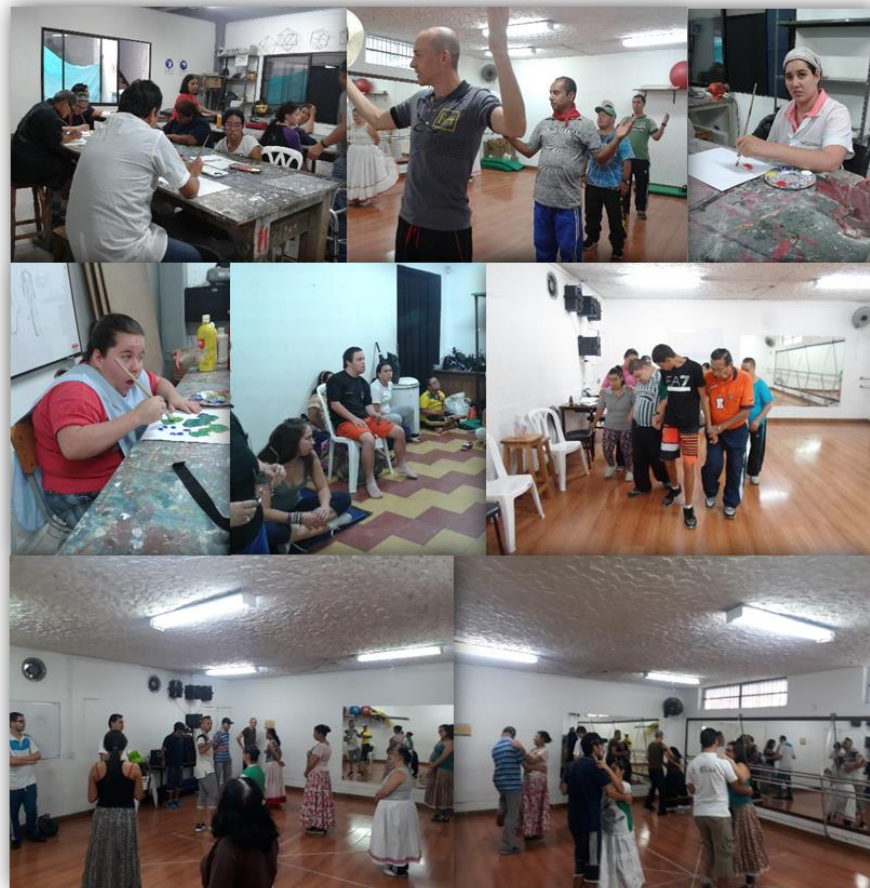
Ilustración 9: Desarrollo formativo cursos de Extensión

Para garantizar el proceso de formación se han hecho inversiones y entrega de materiales para los estudiantes que pertenecen a los talleres de arte en papel, pintura y manualidades.