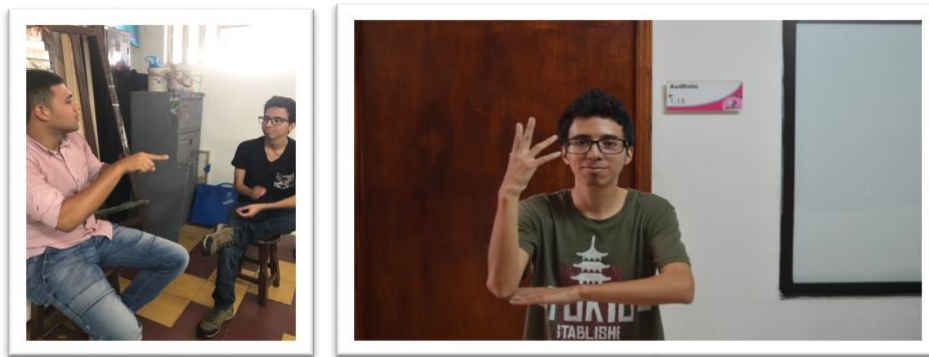
Ilustración 6: Estudiante del Programa Técnico Profesional en Producción de Objetos para las Prácticas Visuales

Desde el año 2016-2 el Programa Técnico Profesional en Producción de Objetos para las Prácticas Visuales cuenta con un estudiante activo en situación de discapacidad: sordo