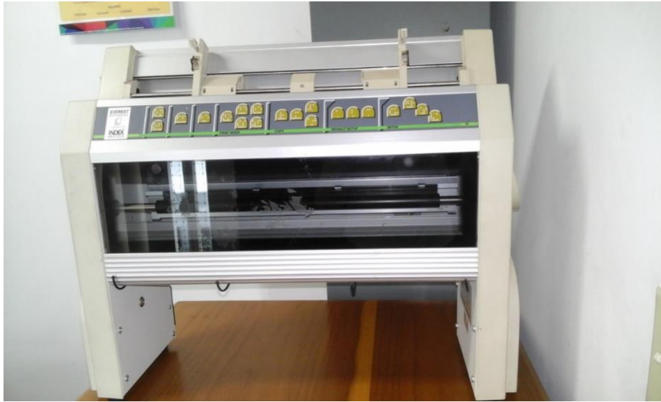
Ilustración 4: (Impresora Braille adquirida por la institución con los respectivos software para su funcionamiento)

El estudiante Julian Argoti en el año 2013 se convierte en el primer estudiante egresado de la Institución en situación de discapacidad, en la actualidad se encuentra radicado en los Estados Unidos ejerciendo su profesión artística.