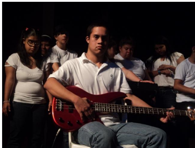
Ilustración 8: Muestra estudiantes de música y teatro, año 2014

Durante 8 años la Institución en convenio con la Secretaría de Bienestar Social ha brindado formación Artística a población con discapacidad física, mental y cognitiva. En ese proceso se ha posibilitado que los beneficiados les resulte más fácil transmitir sus ideas, expresar sentimientos o entablar relaciones, mediante las actividades artísticas, (como la pintura, la danza, la música y el teatro), como medios de expresión alternativos.