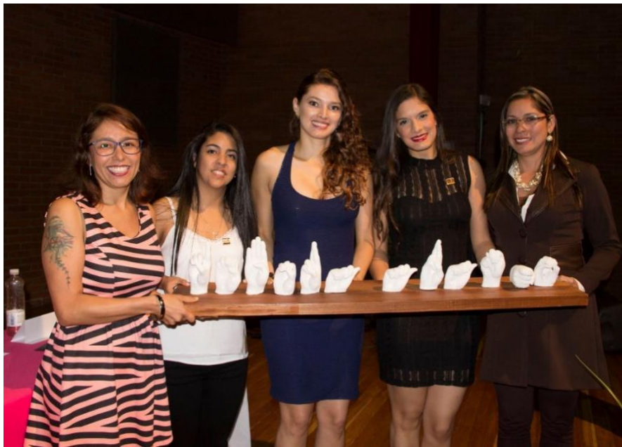
Ilustración 5: Graduadas (Sordas) 2016-1

Tres estudiantes en condiciones de discapacidad: Sordas, egresaron en el años 2015 -1 del Programa Técnico Profesional en Producción de Objetos para las Prácticas Visuales . Posteriormente, en el semestre 2016-2, estas tres estudiantes egresaron del programa Tecnología en Gestión y Producción Creativa para las Prácticas Visuales .