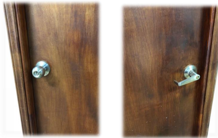
Ilustración 13: Adecuaciones en Infraestructura

Se han desarrollado adecuaciones como la reforma al ingreso de la institución generando una rampa que elimina las barreras de acceso para las personas con discapacidad física al igual que el cambio de las “manijas de perilla” en las puertas por “manijas de palanca” que cumplen con la norma técnica de discapacidad.