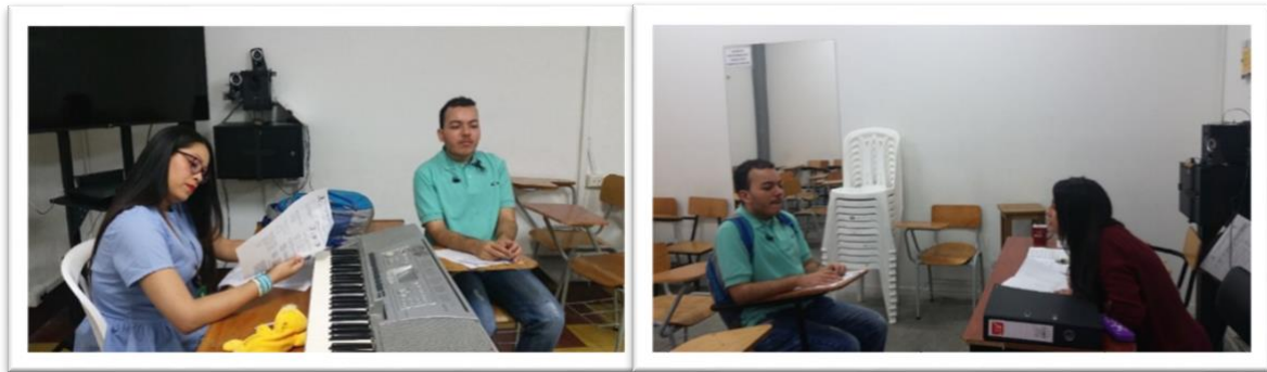
Ilustración 2: Proceso de Admisión Persona en Situación de Discapacidad 2018-1

Al identificar la necesidad del aspirante como por ejemplo personas con discapacidad visual, procedemos entonces a coordinar con docentes y personal administrativo capacitado para apoyar dicho examen y hacer un acompañamiento al aspirante durante toda la prueba.