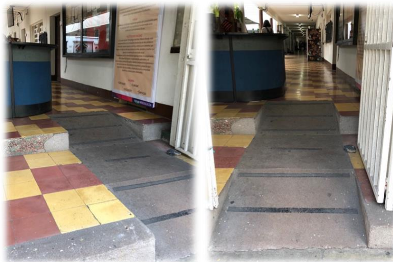
Ilustración 14: Modificación de acceso de la vía peatonal a la Institución